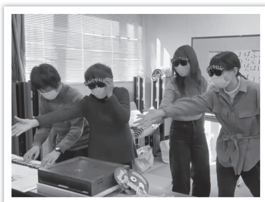
ボランティア活動撮影中

令和3年度からはオンラインによるつながりを充実、地域へ拡大していくことを目的として、大阪府福祉基金地域振興助成金を活用した事業「つながれオンラインArea」の取り組みを始めています。新たな情報発信の拠点として、「ほのぼのかたしも」のオンライン環境を充実させました。ボランティアが遠隔訪問するリモート・ボランティア「リモボラ」などの取り組みをはじめています。