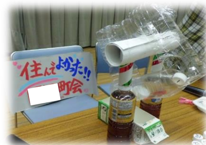
福祉委員手作りガラガラ抽選