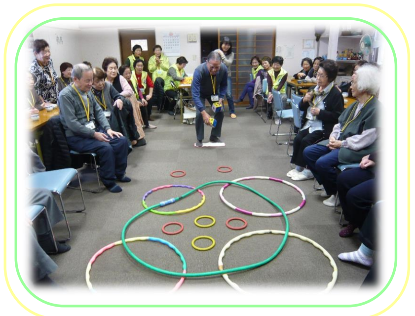
サイコロゲーム写真