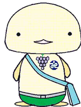
柏原市社協イメージキャラクター ほのぼのちゃん

ちょっとした配慮で誰もが暮らしやすくなる街づくりのためのヒントを、柏原市から全国に発信していきたいと考えています。