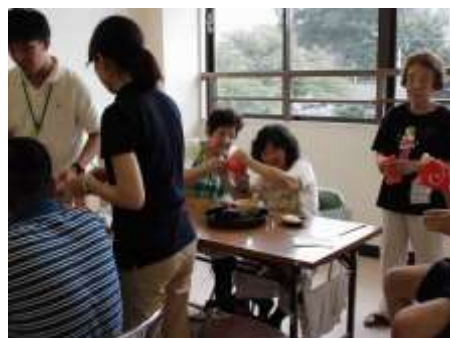
お抹茶サロンの様子

自分も参加者の一人となって、他の方達と交流をするのが私のやり方。その日、みんなで同じ体験を共有することが大切だと考えています。