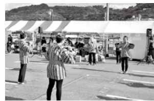
パフォーマンスの様子

連絡会や大 阪介護支援 専門員協会 柏原支部の 啓発、ふー どばんくO S A K A の フードライブなど盛りだくさ んのブースが出店されました。