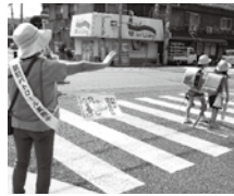
安全パトロールの様子

柏原西地区福祉委員会では毎月第4水曜日に柏原小学校の児童が安全に下校できるように、本郷・大正・古町・今町の福祉委員が平成18年から安全パトロールを行っています。