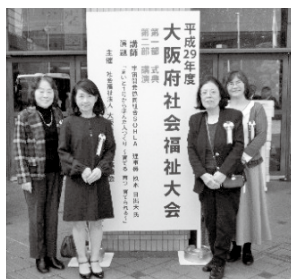
「いちごクラブ」の皆様

図書館にて0歳〜幼児向けに絵本の読み聞かせを行う『いちごクラブ』が「大阪府社会福祉ボランティア表彰」を受賞されました。