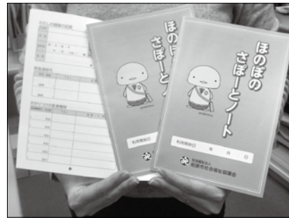
ほのほのさぼーとノート

今後、お世話になるであろう病院や介護サービスにあなたのことを知ってもらうために、今から準備しま