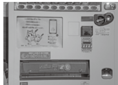
愛ちゃん希望くんが目印です！

赤い羽根共同募金協力型自動販売機が竜田古道の里山公園スマイルランドに設置されました！