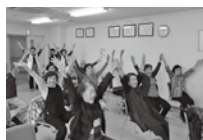
ケアカフェの様子

脳活バランスはパソコンを使ってゲーム感覚であたまの健康チェックができます！定期的に行うことで脳力アップを目指しませんか？