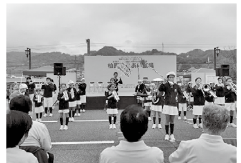
第28回 柏原ふれあい広場の様子

皆さんで地域共生社会の実現に向けて、手と手を取り合いつながりあえるまちづくりを目指しましょう。たくさんの人とつながりあえる、柏原ふれあい広場でお待ちしています！