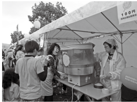
第28回 柏原ふれあい広場の様子