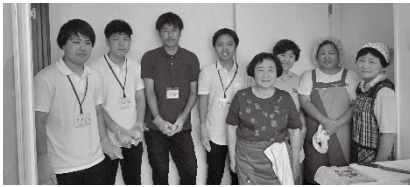
調理の様子 (ボランティアと実習生)