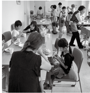
みんなでおいしく「いただきます！」

楽しい会食の時間を過ごし、皆さんから「また実施してほしい！」とたくさんのご感想をいただきました。