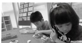
子どもたちも楽しそう!