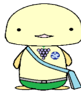
柏原市協 イメージキャラクター 「ほのほのちゃん」

毎年1月17日は「防災とボランティアの日」となっています。 近年では、大地震や大雨による土砂災害、噴火など様々災害が起こっており、 一層、災害に対する思いを深める日にするために開催します。