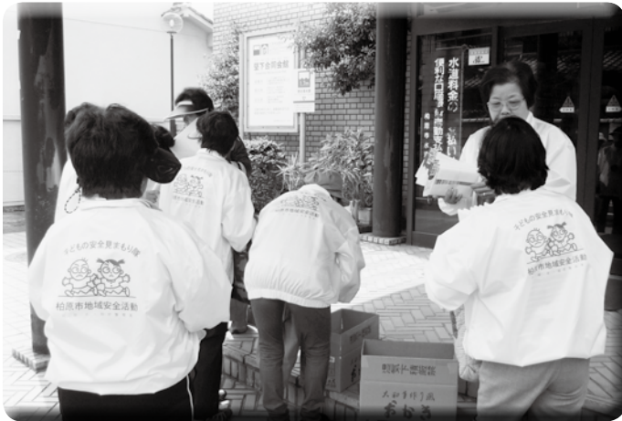
(友愛訪問の準備を行う地区福祉委員の皆さま)

できるよう地域住民が主体となつて支え合い、助け合う活動を展開しています。他の活動として、地域の中で交流・仲間づくりを目的とした「ふれあいサロン」や小中学校の子供たちと交流する「世代間交流」等の活動があります。