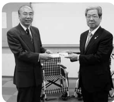
有効に活用させていただきます

5月2日に大阪中河内農業協同組合（高安組合）より車いす15台の寄贈がありました。車いす短期貸し出し事業で使用させていただきます。ありがとうございます。ありがとうございました。