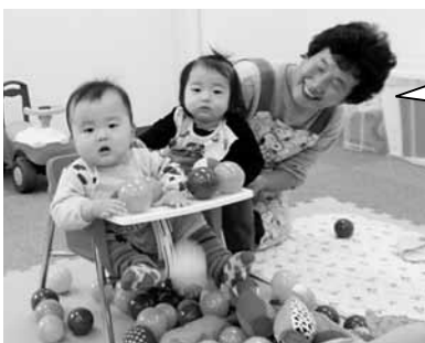
ファミサポサロンの様子

ミニボールプールやママゴトセット、どうぶつボールリングもあるよ! 一緒に遊びましょう! 待ってまーす☆