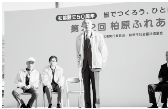
松永会長のあいさつ

今回は社協設立50周年記念という節目の年でもあります。今回も地区福祉委員会や民生児童委員協議会、ボラン