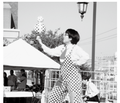
大道芸のステージ

模擬店・バザーも長蛇の列、14時までには全てのお店が完売するほどの大盛況。お天気