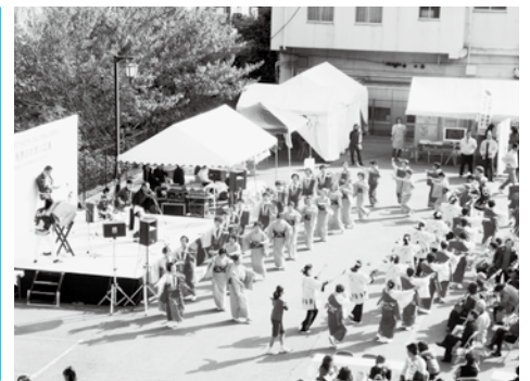
河内音頭で大盛り上がり