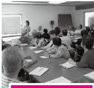
ふれあいサロンの様子

玉手中学校の世代間交流では、国分西地区福祉委員会と共同で、芋・花の苗植えや文化祭・体育祭などに参加しています。そのほかに、一人暮らしの高齢者の集まりである「七星会」への活動支援も積極的にを行っています。