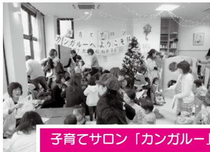
子育てサロン「カンガルー」 毎月ほのぼのかたしもで開催

「出来ることからやりましょう、生き生き老後へ力添え」をスローガンに高齢者の方、子育て中の方を対象にした活動に力を入れています。